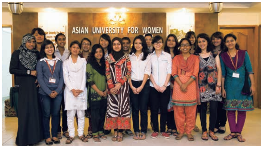
獲得 UNIQLO 獎學金的學生們

在貧困人口佔總人口半數以上的孟加拉，一所致力培養未來領導人才的大學——亞洲女子大學已成立了近六年。UNIQLO 以提供獎學金的方式對亞洲女子大學給予支援。