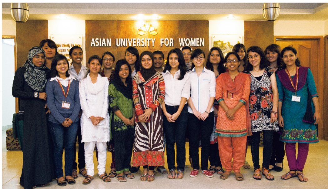
獲得 UNIQLO 獎學金的學生們

在貧困人口佔總人口一半以上的孟加拉， 一所致力於培養未來領導型人才的亞洲女子大學， 自創校六年以來 UNIQLO 以提供獎學金的方式給予亞洲女子大學鼓勵與支援。